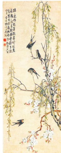
清 李颀《桃花柳燕图》