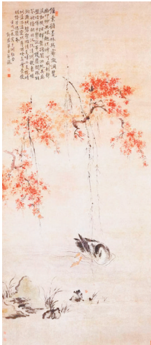
清 华岳《桃潭浴鸭图》