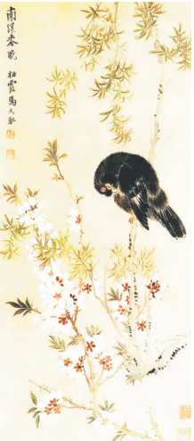
明 马元取《南溪春晓图》