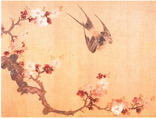
明 周之冕《杏花燕子》