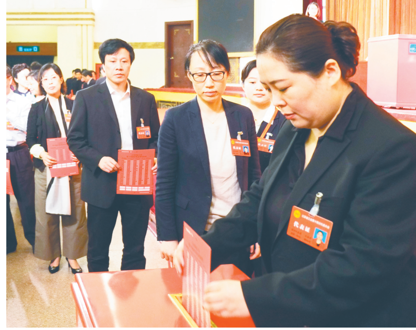
4月25日上午,省工会十四大选举产生了127名江苏省总工会第十四届委员会委员、27名经费审查委员会委员。