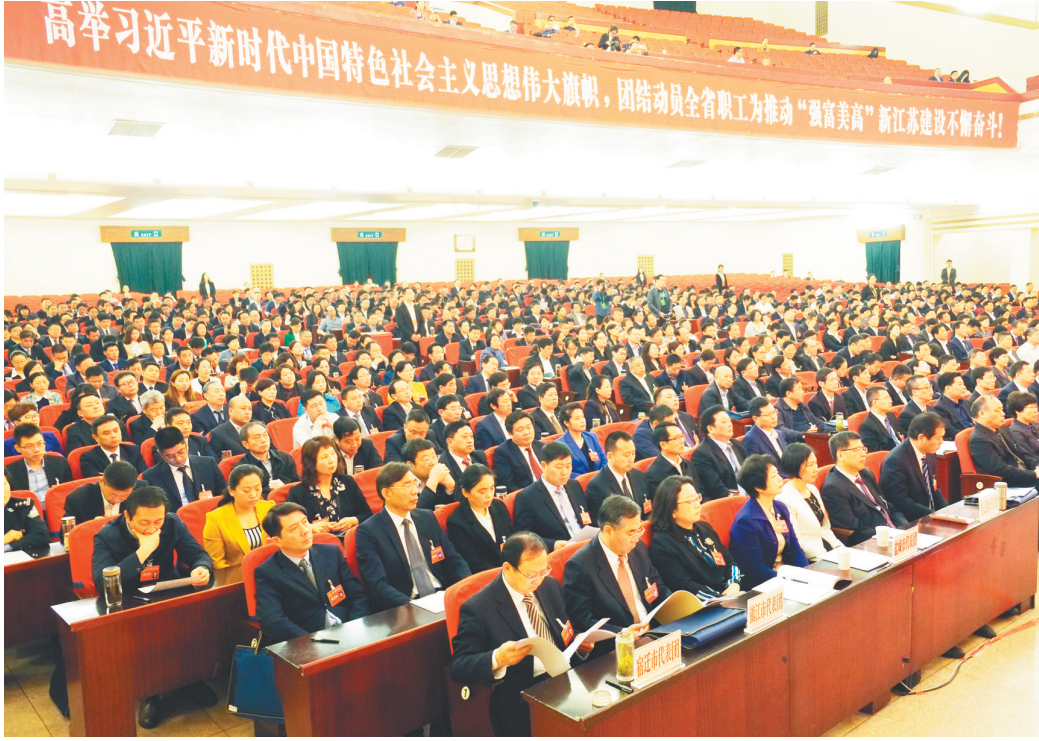
昨日下午,江苏省工会第十四次代表大会在南京胜利闭幕。

本报讯(记者 谢丹娜)4月25日下午,江苏省工会第十四次代表大会在南京胜利闭幕。