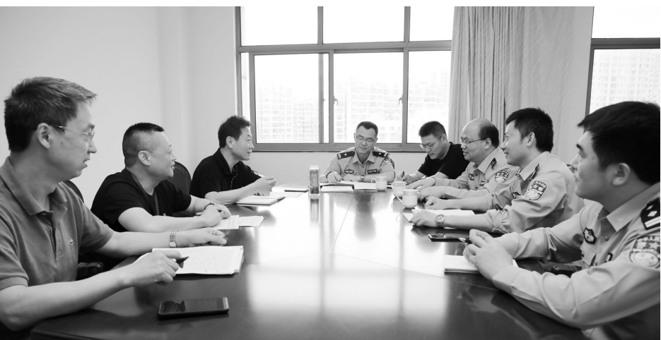
钟楼法院和钟楼公安分局日前召开联席会议,互通拒不执行判决裁定案件移交侦办开展情况,成立拒不执行人民法院判决裁定案件“510”专案组,强化沟通协作平台机制建设,提高依法侦查审判质效。