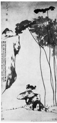
《荷凫图》清 朱奎(美国弗利尔美术馆藏)