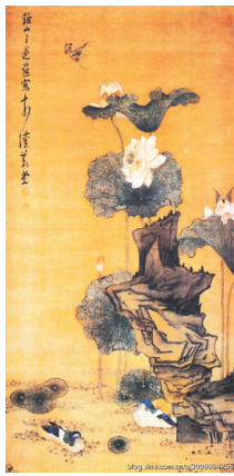
《荷花鸳鸯图》明 陈洪绶