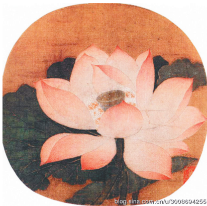
《出水芙蓉图》南宋 吴炳(北京故宫博物院藏)