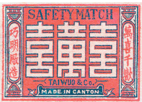
万喜千欢(十九世纪)