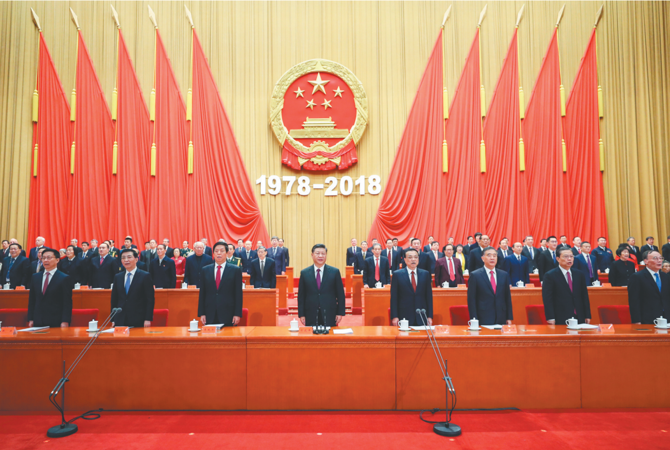
12月18日，庆祝改革开放40周年大会在北京人民大会堂隆重举行。习近平、李克强、栗战书、汪洋、王沪宁、赵乐际、韩正、王岐山等出席大会。

新华社电 庆祝改革开放40周年大会18日上午在北京人民大会堂隆重举行。中共中央总书记、国家主席、中央军委主席习近平在大会上发表重要讲话。