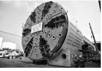
后,将与浦仪公路串连起八卦洲、浦口、仪征、江南和核心区,对促进区域间经济发展,提升南京市交通路网区域枢纽功能,方便市民交通出行意义重大。

据了解,和燕路过江通道建成通车后,将与浦仪公路串连起八卦洲、浦口、仪征、江南和核心区,对促进区域间经济发展,提升南京市交通路网区域枢纽功能,方便市民交通出行意义重大。