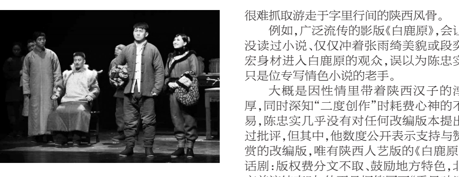
陕西人艺版《白鹿原》剧照

2016年，陕西人艺话剧《白鹿原》在全国十余个城市巡演，不仅让观众看到了中国话剧的良心和水平，更是得到业界媒体的“交口称赞”，不负陈忠实“最满意的改编版本”的赞誉。5月18日和19日，陈忠实最满意的这一版话剧《白鹿原》在南京保利大剧院上演。