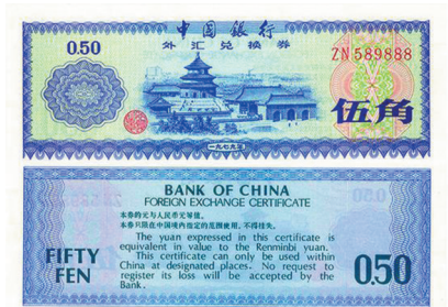
伍角 北京天坛(蓝紫色)