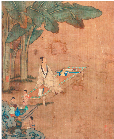
邓文举《蕉荫纳凉图》

时,澳门回归20周年纪念钞开始网上预约,到时除了回归20周年纪念钞,连同历年已发行的四款生肖钞,也可以合并预约兑换。(兑换时间是10月21日~12月19日)