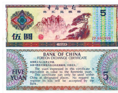
伍圆 黄山风景(棕红色)