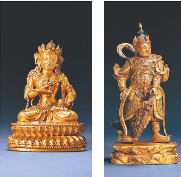
铜鎏金摧破金刚款识： 铜鎏金韦驮 “大明永乐年铸”

明永乐铜鎏金摧破金刚,作为永乐宫廷造像的代表,尽显华丽与庄严。永宣宫廷造像充分继承了元代以来阿尼哥炉火纯青的失蜡法,做工精致入微,气质典雅唯美,具有典型的皇家气象。风格上弱化了梵藏造像之特点,融入汉地传统审美文化,表现为高度融合的艺术特征,并以铜质细腻、鎏金纯厚明亮、装饰华丽而著称。