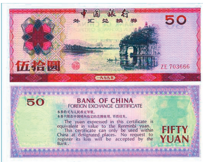
伍拾圆 桂林象鼻山(枣紫红色)