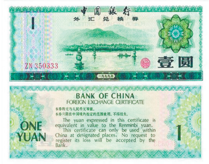
壹圆 三潭印月(蓝绿色)