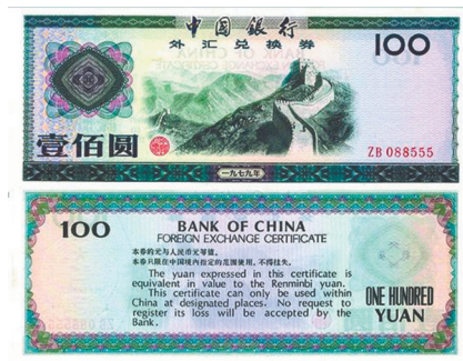
壹佰圆 万里长城(黑蓝、紫绿色)