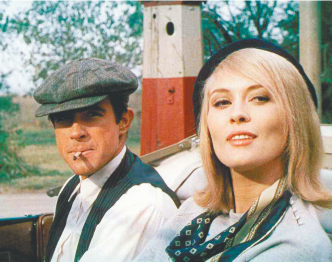
《邦妮和克莱德》剧照

13、《邦妮和克莱德》。导演阿瑟·佩恩40岁才凭借改编剧本进入电影界，对强盗人物、亡命之徒有着偏爱，除了本片外，他还拍摄过一部著名电影《左手持枪》，对亡命徒从社会、心理进行了深刻探讨。男主角沃伦·比蒂凭借电视剧迈上演艺之路，第一部电影《天涯何处无芳草》就让他赢得了金球奖最佳男演员提名，随后他主演了不少著名电影，包括《风流绅士》、《天堂可以等待》、《烽火赤焰万里情》和《巴格西》等；在多次获得奥斯卡最佳男演员提名而未果后，他凭借《烽火赤焰万里情》获得了最佳导演奖。他曾是好莱坞最著名的花花公子，与无数女演员有过情感纠葛，1991年他