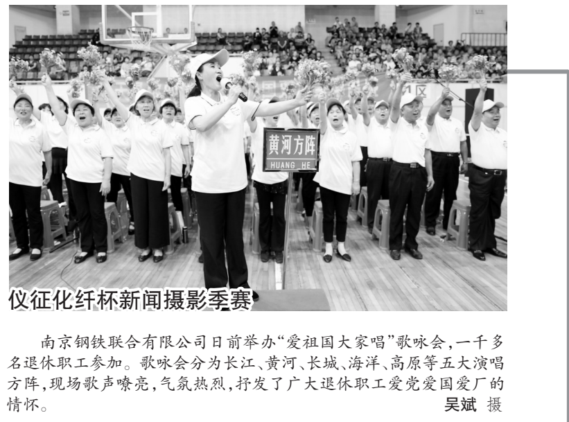
仪征化纤杯新闻摄影季赛

基础较差,在此次“创星”活动中,他们实现弯道超越,建起了全县一流的“职工之家”。目前,该县有60个基层工会实现提档升级,80个实现规范运作,新增植各类典型工会18个。有15个单位被授予2018年度“五星级工会”荣誉称号,15个单位被授予“四星级工会”荣誉称号,30个单位被授予“三星级工会”荣誉称号。