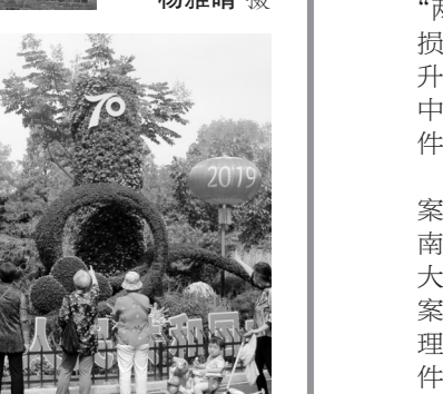
在喜迎新中国成立70周年之际,南京公共广场、公园和街头一处处栩栩如生、多姿多彩的“绿雕”,犹如镶嵌在“石城绿肺”上一颗颗绿宝石,给国庆节前的南京披上绚丽的华彩!