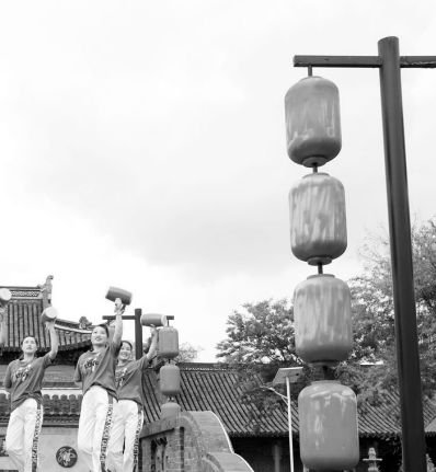
向中林 杨雅晴 摄