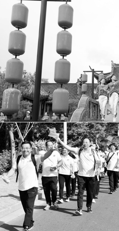
海安市高新区新隆办事处日前联合江苏华艺集团举行“追寻红色足迹,重温革命精神”35公里徒步活动,100多位党员干部及新招聘的大学生徒步前往海安第一个中共党支部——管彦党支部,接受党性教育,喜迎新中国70华诞。