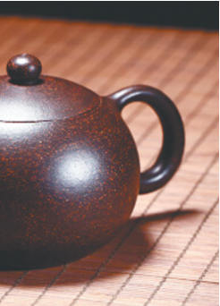
明清窑厂在烧制中偶然得到的珍稀高温黑色紫砂器,曾专供皇家使用,乾隆后期该技

艺失传。如今经过艺术家多年研究,黑色紫砂器重现。故宫出版社近日出版新书,展示了180件现代黑紫砂器,揭秘重生过程。