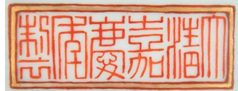
铁红色釉上珐琅嘉庆六字款