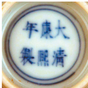
釉下青花大清康熙年款