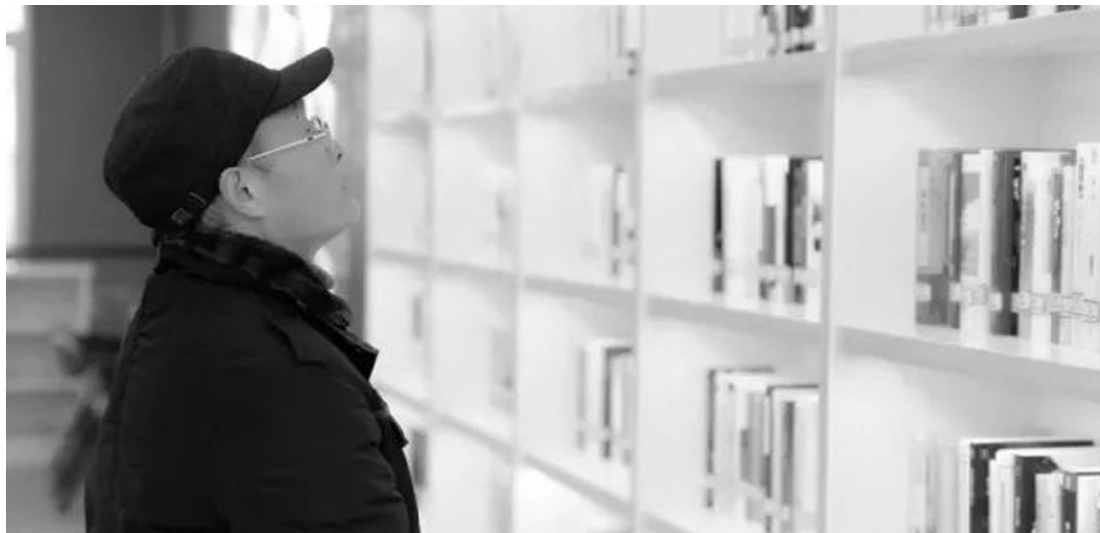
【书香书影】 城市书房里的守望。