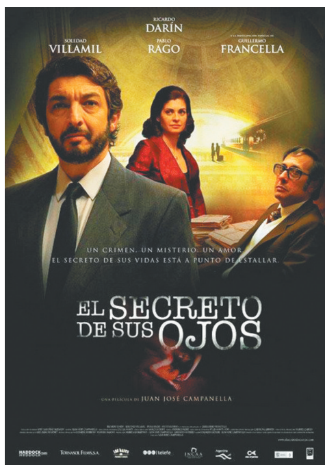
《谜一样的双眼》海报。