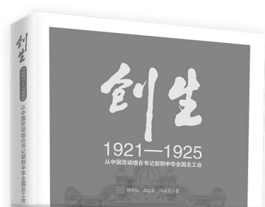
(钟葆高 高志菲 闫永飞 著 中国工人出版社)

本书重点讲述与病毒有关的历史事件,以及人类与病毒漫长的斗争史,开篇即以人类历史上非常严重的一次病毒疫情——“西班牙大流感”的故事为引子,揭开病毒的神秘面纱,还重点介绍了昆虫、鸟类、蝙蝠的进化史,揭示了病毒、动物、人类三者之间的复杂关系,最后总结人类不断发展、进步的医疗技术,给读者战胜病毒的希望,并呼吁大家爱护自然环境,与健康和谐相处,提倡健康生活与科学防疫。