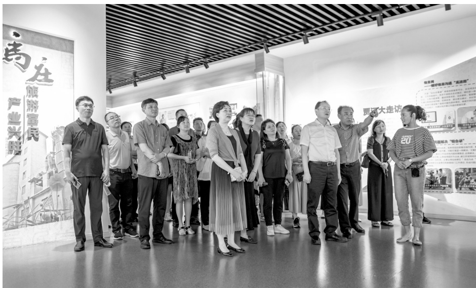
8月4日,江苏省交通运输工会干部培训班在徐州市工会干部学校举办,所属各单位工会107名工会干部参加培训学习。培训为期4天,特邀中国劳动关系学院党委副书记、纪委书记刘路刚讲授《工会干部的底线思维和基本素养》,并根据基层工会干部需要安排了理论培训和提升,还开展了实践教学。图为学员在参观“马庄文化”特色党建教育基地。

企业开展党建带工建“三争创两提升”活动,提升基层党建组织的政治引领力和职工群众组织力,推进全市产业工人队伍建设。聚焦党员管理。共享联盟单位的各项资源、活动计划,同上“微党课”,把分散活动变成集体“大课堂”,实现党员教育一体化。发挥各成员单位的资源优势,开展党建交流。在坚持“三会一课”学习制度的基础上,定期举办联盟单位联席会,开展主题党日,交流工作经验,充分发挥党员的先锋模范作用。聚焦服务职工。走访征求职工关于党建工作的服务需求,同时根据联盟成员单位的服务资源和服务内容,双向列出资源清单和需求清单,开展双向认领,协商确定服务项目,为职工提供力所能及的医疗卫生、健康咨询、法律援助、结对帮扶、走访慰问、志愿服务等活动,维护好职工群众的合法权益,增强职工群众的获得感、幸福感。