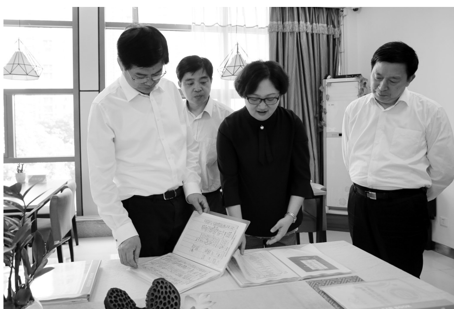
省人大常委会副主任,省总工会主席魏国强(左一)在无锡市滨湖区蠡湖街道总工会职工之家调研

疫情以来,公司6000余名职工“零感染”。经此一役,公司工会“为奉献者奉献,与逆行者同行”的积极作为进一步彰显,职工之家建设得到了空前的考验和锤炼,优秀工会干部和职工典型脱颖而出,建家工作必将发挥更大作用、体现更大价值。