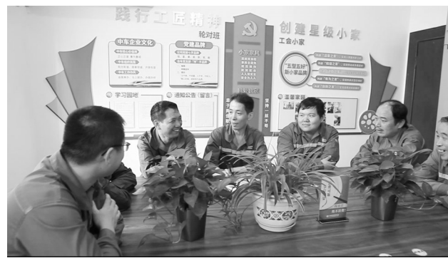
中车常州车辆有限公司职工在职工小家共议工作

三是依靠职工参与,完善考核评价机制。公司工会通过调研摸底、征求意见等方式,了解职工的建家需求,制定《“星级职工小家”创建管理办法》,明确“五星”职工小家星级设置和评比标