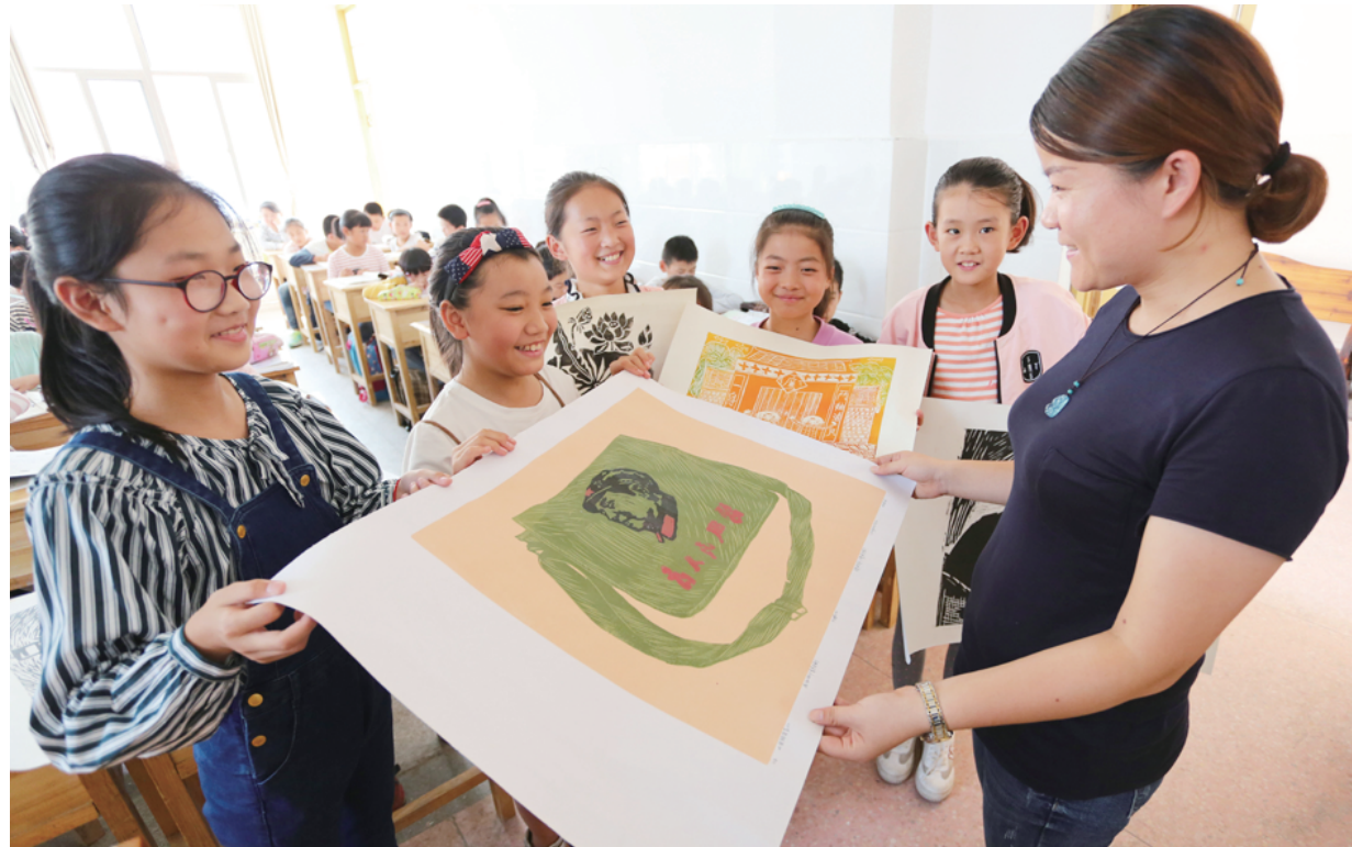
近日,东海县委、教育局联合开展了以“不忘初心、廉洁从教”为主题的教育活动,通过组织教师签订师德承诺书、重温从教誓词、观看警示案例等多种形式,营造“敬廉崇洁”的执教氛围,过一个风清气正的教师节。图为东海县实验小学学生将创作的廉洁版画赠送给老师。

不仅盐都区党委、政府对教师节庆祝活动进行了改革,各中小学、幼儿园也创新了庆祝方式。南京师范大学盐城实验学校举办了一场温情十足的教师节文艺晚会,但与其他学校不同的是,这场联欢晚会由家长委员会自发组织,家长、学生和教师同台演出。盐城市海陵路幼儿园针对新进年轻教师较多的实际,向每名教师赠送了3本专业用书,以指导新教师的新学年工作。盐都区中兴幼儿园则组织全体教师进行健康体检,园长顾霞说:“没有比送健康更好的教师节礼物了。”