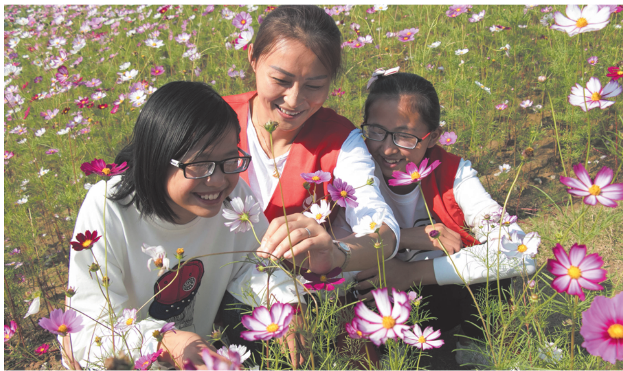
10月6日,淮安市涟水县“爱心妈妈”带领当地留守儿童在保准镇百花园赏景游玩。依托“爱心妈妈”项目,涟水县爱心志愿者们与留守儿童结对,陪伴他们阳光成长。图为“爱心妈妈”与孩子们闻香赏景。

据悉,此次专项治理行动以各市(县)、区相关部门为主,市、区两级整体联动,分为摸底排查、整治行动、检查验收3个阶段,行动包括8个方面:清理非法办学的无证无照机构;规范机构办学资质;整治由教育部门审批的非学历教育机构超范围开展的培训;整治在职中小学教师在校外培训机构有偿补课;整治机构发布违法广告;整治机构乱收费;整治校舍消防安全隐患;整治公司经营范围内含有培训,但针对中小学校和幼儿园学生开展学科类及学科延伸类培训。