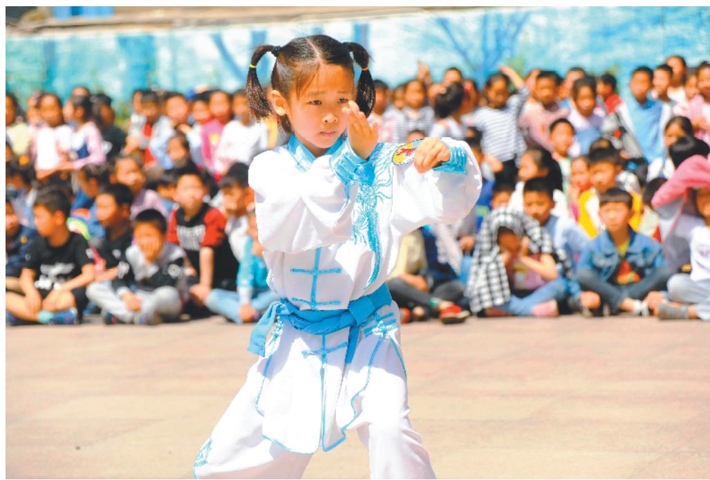
5月23日,淮安市清江浦区太极拳协会到该区实验小学开展传统武术进校园活动,在丰富学生课余生活的同时,弘扬传统武术文化。图为活动现场。侯育永 摄

据悉,目前我省共有1383所学校被确定为全国青少年校园足球特色学校,雨花台区等6个县(市、区)被确定为全国青少年校园足球试点县(市、区);省教育厅、体育局确定了13个省首批青少年校园足球试点县(市、区),135所幼儿园被命名为省足球特色幼儿园;我省具备招收足球高水平运动队资质的高校已达12所;参与校园足球活动人数从2015年65万人次、2016年80万人次,增长至2017年110多万人次。2015年至2017年,全省共举办省级师资培训班130余期,培训教师6000余人次;每年选送20名体育教师、60名足球运动员赴巴西等国开展交流培训成为常态。目前,南京体育学院和淮阴师范学院已分别组建足球学院,多渠道、多层次校园足球师资队伍体系建设正在形成。