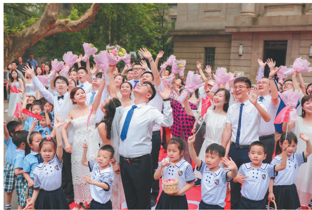
今年是东南大学建校116周年暨更名30周年。6月5日,校庆前夕,包括在校师生、校友在内的30对东大伉俪在四牌楼校区大礼堂前携手,对母校“告白”,祝母校116周岁生日快乐。

三是加大科技创新。要进一步强化高校科技与地方政府、园区、企业的有效对接,鼓励高校与市县共建研究院,与高新区、开发区共建科技平台,与企业共建实验室、工程中心。组织高校积极参加各类对接会、洽谈会,推动大批科技项目成果向产业转移转化。高等学校与企业间要破除壁垒,深度融合,激发活力,协同创新。