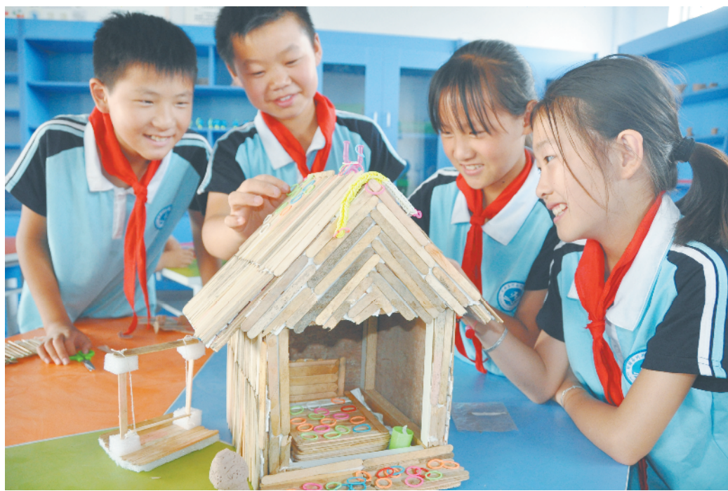
6月22日,盱眙县河桥中心小学劳技社团的孩子们将拾捡收集来的雪糕棒,清洗后制作成“小木屋”“战士大刀”“现代步枪”等手工作品,旨在培养勤俭节约习惯,增强保护青山、守护绿水的环保意识。图为孩子们在装饰“小木屋”。

“目前,我们已筹集善款7万余元。”许娟说,“筹集到善款后,我们都通过红十字会捐赠给在儿童医院血液科接受治疗的患儿。我相信,天域幼儿园会有更多的志愿者将这个美丽的故事延续下去。”