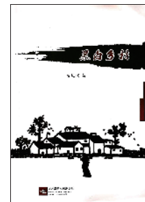
《黑白乡村》 曹达桐 著 江苏凤凰文艺出版社

与一场雨雪邂逅之后,刺骨的寒意悄然挥洒到土地的深层,呼吸到的空气顿时有了一些萧索的味道——冬天的气息一下子溢出纸间,作者对乡村的勾勒,让人不觉拊掌叫好,默然赞叹。