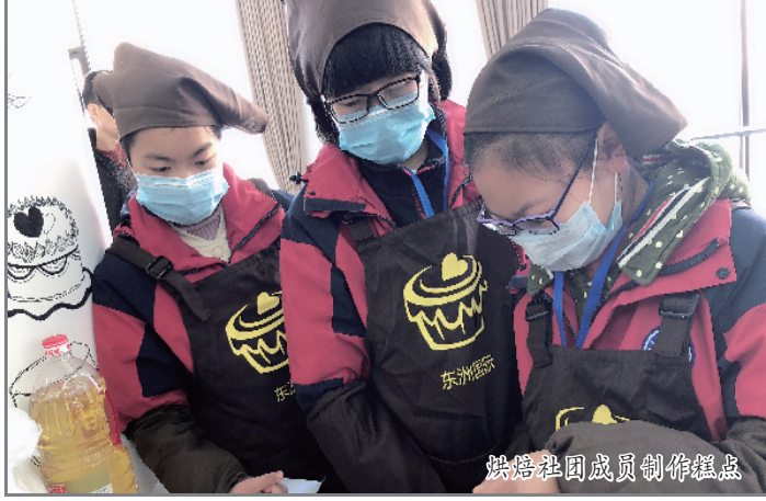
烘焙社团成员制作糕点