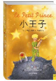
《小王子》 [法]圣埃克苏佩里 著 新蕾出版社

童话并不只是给儿童读的。我建议大朋友们花上半天时间，静读一遍《小王子》；我建议小朋友们也