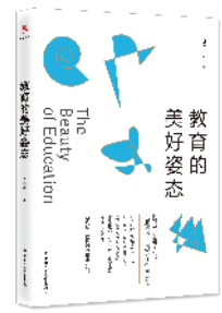
《教育的美好姿态》 肖培东 著 中国人民大学出版社