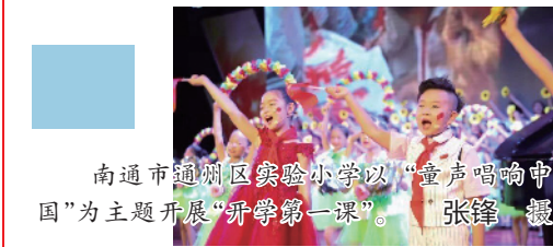
南通市通州区实验小学以“童声唱响中国”为主题开展“开学第一课”。