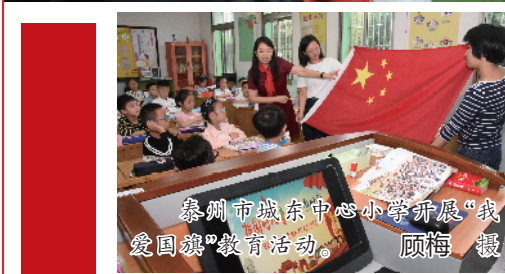
泰州市城东中心小学开展“我爱团圆”教育活动。顾梅 摄