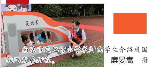
南京市天妃宫小学教师向学生介绍我国铁路发展历程。