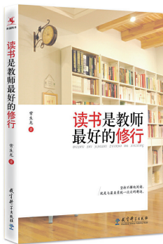
《读书是教师最好的修行》 常生龙 著 教育科学出版社

我一直坚信:持之以恒的阅读,是与最美景致的一次次相遇。读完常生龙《读书是教师最好的修行》一书后,我更加明白:如果教育是人与书的相遇、人与人的相遇,那么,阅读就是与创造、与生活、与社会、与支点、与未来相遇,是连接彼此美的相遇。