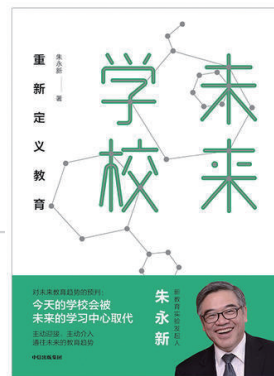
《未来学校》 朱永新 著 中信出版集团

当下,全社会对教育的关注达到了前所未有的程度,关注与议论的背后不仅有对当下的焦虑,也有对未来的迷惘。