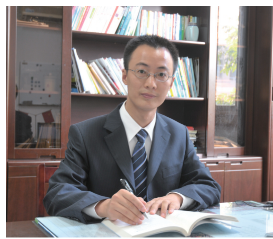
缪德军,如皋市教育局党组成员、副局长(挂职)、江苏省白蒲高级中学党委书记、校长,江苏省优秀共产党员