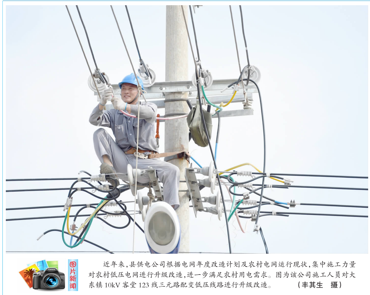
近年来,县供电公司根据电网年度改造计划及农村电网运行现状,集中施工力量对农村低压电网进行升级改造,进一步满足农村用电需求。图为该公司施工人员对大东镇 10kV 客堂 123 线三路配变低压线路进行升级改造。

风扇、机箱、机房地面无灰尘,为设备提供一个良好的卫生环境,保证设备正常运行。三是保证空调高效运转。定期对空调过滤网、散热片进行清洗,避免空调内过脏导致空调不制冷,影响监控室的规定温度,防止高温下设备出现线路短路,防止服务器硬盘、主板温度过高引起各种故障,确保设备正常运转。四是加强监控机房的的安全巡查。定时检查机房监控设备的运转情况,实时做好各类台账的记录工作,杜绝安全生产事故发生,确保收费工作正常开展。(刘帆)