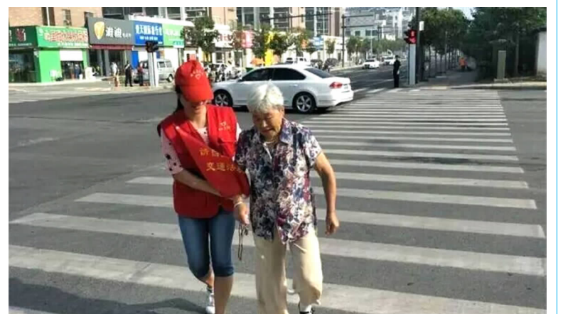
8月28日，县中医院文明创建志愿者充分发扬“奉献、友爱、互助、进步”的精神，开展志愿服务活动。