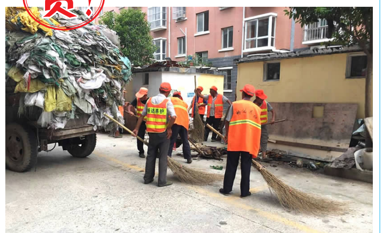
8月28日，县交通运输局养护公司人员冒雨继续对军民社区脏乱差现象进行整治。