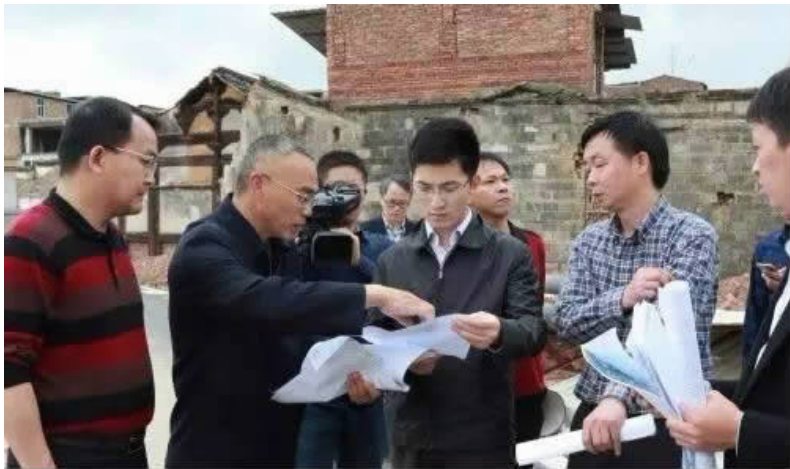
2017年2月22日下午,上杭县委副书记、县长王波调研旧城改造(棚户区)和汀江绿道建设。