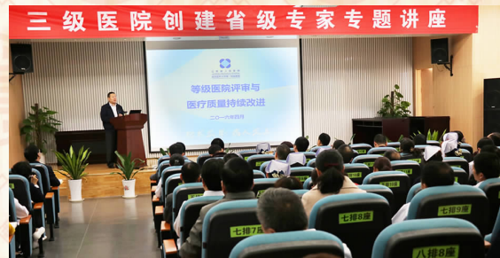
省人民医院等级医院评审专家来该院指导三级医院创建工作