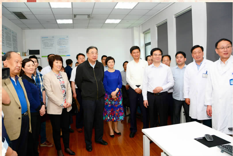
国家卫计委副主任马晓伟来该院视察工作

成为三级综合医院后,对提升医院综合医疗服务能力,推动城乡、区域医疗事业协调发展,加快构建现代医疗卫生体系都起到重要作用,在救死扶伤、防疫治病、提升群众卫生素质等方面,更能充分发挥出人民医院主力军作用。