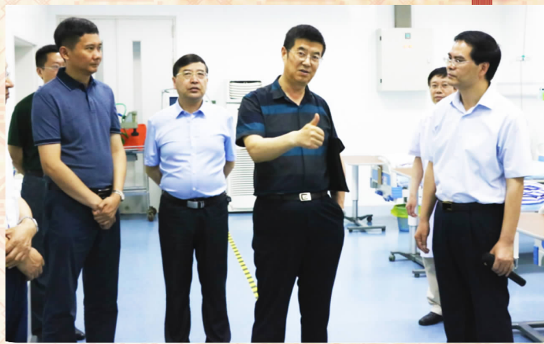
省卫计委副主任李少东来该院调研