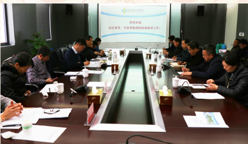
省卫计委专家组现场验收该院转设三级医院工作