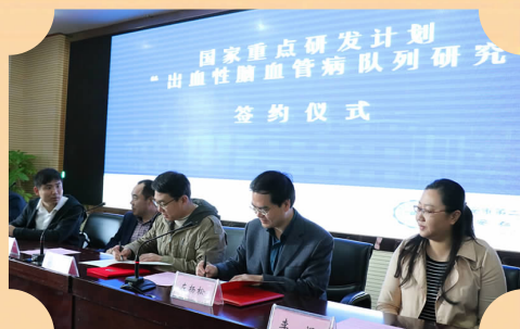
复旦大学附属华山医院与该院签订合作协议