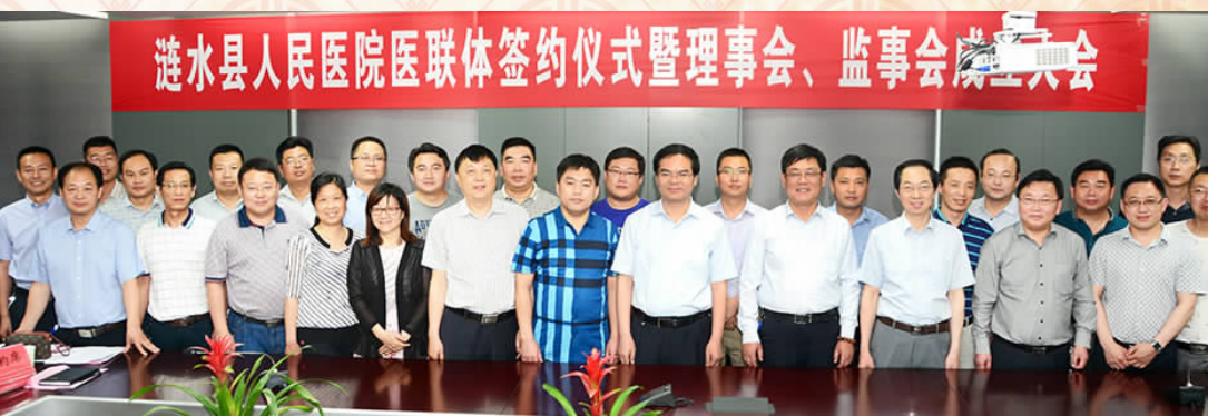
县内医联体签约仪式暨理事会、监事会成立大会