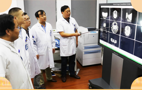
远程影像诊断中心