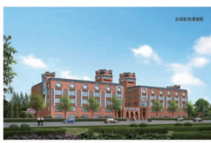
培训机A幢(二期) 培训机B幢(三期)

涟水瑞恩帝儿教育科技有限公司培训中心项目位于淮浦路西侧、淮河路北侧,由涟水瑞恩帝儿教育科技有限公司建设,该方案由淮安市拓思达建筑设计院有限公司设计。