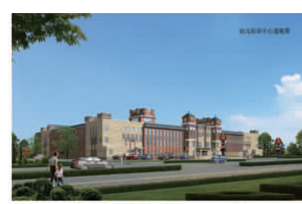
幼儿培训中心(一期)