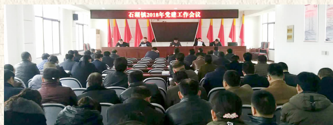
石湖镇2018年党建大会

该镇面对新形势和从严治党的新要求、新特点、新部署,将认真贯彻“十九大”精神,汇聚基层党组织的发展合力,完善制度,创新机制,积极探索党员服务群众长效机制,切实增强党的基层组织服务经济社会发展的能力,提升经济发展水平,为加快建设“强富美高”新石湖而不懈努力。