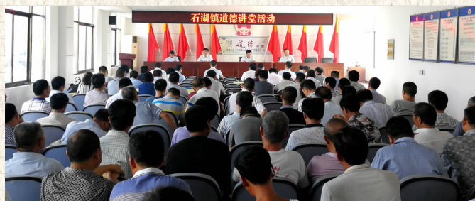
石湖镇党建工作会