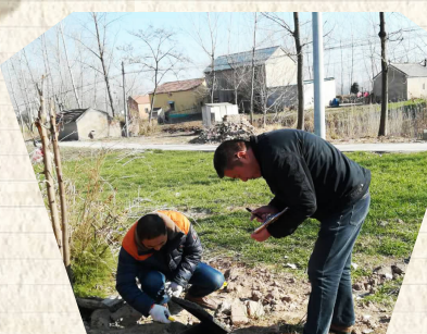
石湖镇农村改水工作

今年上半年,石湖镇坚持“以人民为中心”的新时代党的基本方略,将关注民生问题列入工作纲领,对为民办实事、为民办好事的工程项目提出更高的要求,围绕供水改造、环境整治、基建改造等与人民生活息息相关