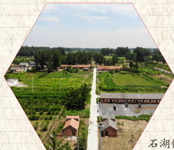
石湖镇花果湖果园

石湖镇目前保存有大量知青时期的物品,充分体现了知青上山下乡的成绩,这些物品虽然已破旧,但却能生动的再现那段火热岁月的场景。