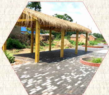
石湖镇花果湖果园