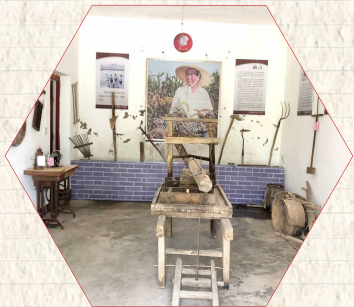
石湖镇农耕文化陈列馆