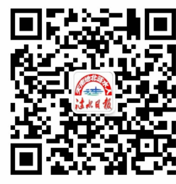
天南地北涟水人 微信公众号