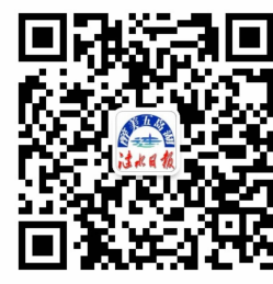
醉美五岛湖 微信公众号