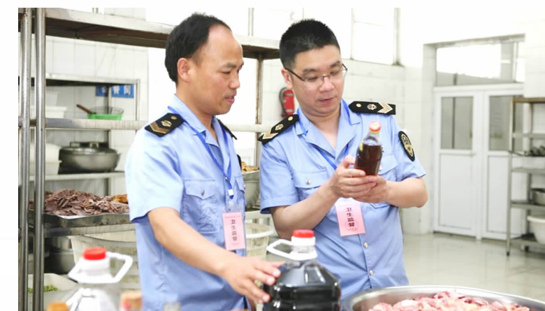
县市场监督管理局组织对全县大中型餐饮单位进行检查

能整合优势,在推进追溯体系建设、畅通消费维权渠道、常态化打击侵权假冒等方面作出了不懈努力,打出了推动诚信经营的组合拳,为全县人民买得放心、用得放心、吃得放心提供了有力保障。3月5日上午,在全国两会第二场“部长通道”上,国家市场监督管理总局局长张茅表示,今年要加强对假冒伪劣制造的惩罚力度,实施最严厉的惩罚,让造假者付出付不起的成本。近年来,县市场监管局从未停止过对制假售假的查处和打击。查处了某医疗机构侵害消费者权益案、王某销售标签不符合食品安全国家标准的婴儿配方奶粉案等2件罚没款超过百万元的大案,查办红窑镇张红非法经营药品案等案件61起,捣毁非法传销窝点6个,使我县食、药品市场环境更加清明。