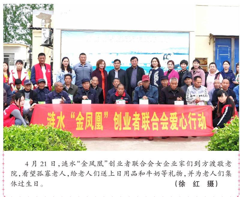
4月21日,涟水“金凤凰”创业者联合会女企业家们到方渡敬老院,看望孤寡老人,给老人们送上日用品和牛奶等礼物,并为老人们集体过生日。