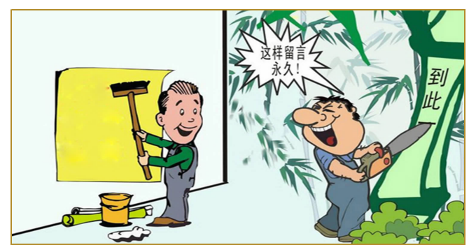
爱护公共设施,不乱刻乱画