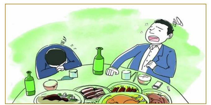
不浪费饭菜,不过分劝酒