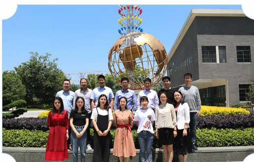
国家级示范课展示、省部级优课竞赛获奖老师