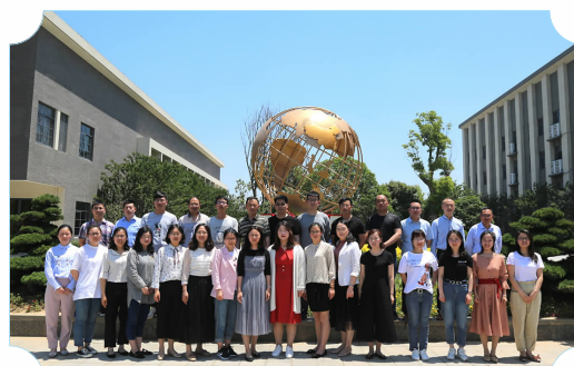
市县级优课获奖老师