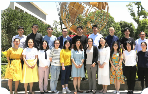
市县级优秀班主任、优秀教育工作者