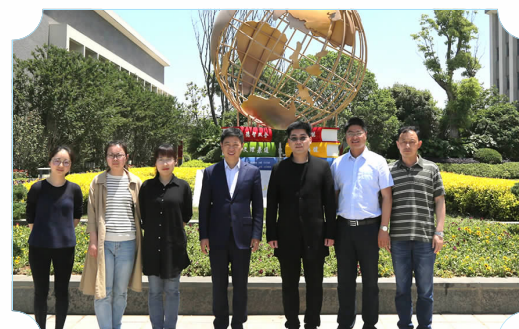
周恩来班班主任及先进个人