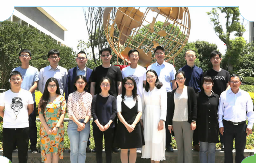
市县级基本功大赛一二等奖获奖教师