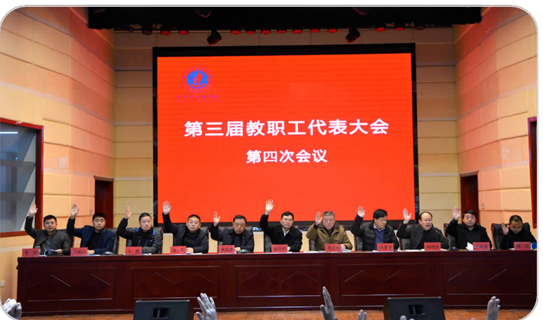
召开教职工代表大会

潮平两岸阔,风正一帆悬。新的学期,淮文外国语学校全体教职员将以更高的工作热情,更实的工作作风,全身心地投入到涟水教育事业之中去,为重塑涟水教育新辉煌贡献淮文应有的力量。