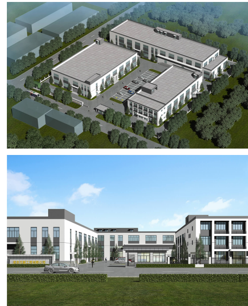
服装及针织品加工项目鸟瞰图 主入口透视图