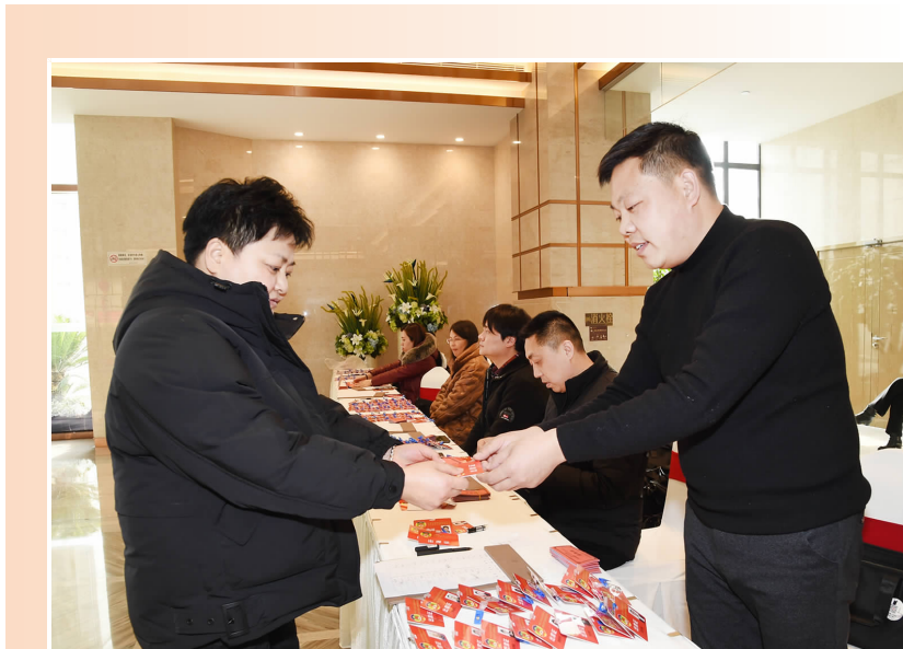
政协涟水县十届四次会议会务组工作人员为报到的政协委员热情服务。

挥自身优势,认真履行好政协职能。要规范撰写提案,着重围绕县委、县政府中心工作和人民群众普遍关心的热点、难点问题提出提案,要实事求是地提出问题,客观公正地分析问题,提出的建议要有可行性和可操作性。要严格遵守会议纪律,服从安排,不得迟到,不得提前离场,不得无故缺席,特殊情况请假需书面报告,并经主席会议研究批准。县政协将对委员出席会议情况认真考勤,全体委员要严格执行中央和省、市、县委的相关规定,以新的作风、新的形象展现出良好的风采。