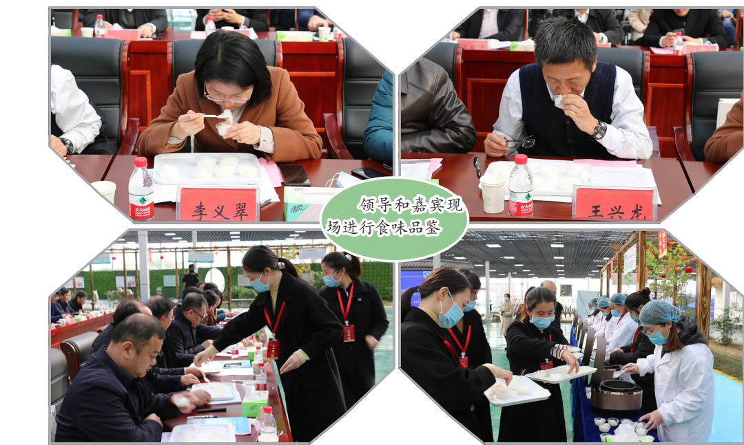
领导和嘉宾现场进行食味品鉴