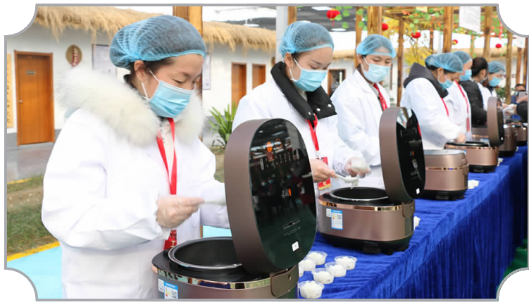
各种品牌“南集大米”悉数登场