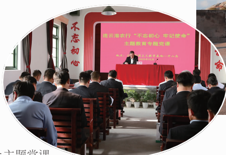
在开山岛上主题党课