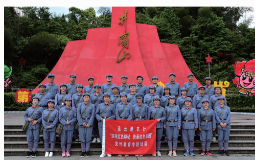
赴井冈山开展党性教育培训