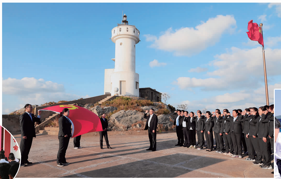
赴开山岛开展主题党日活动