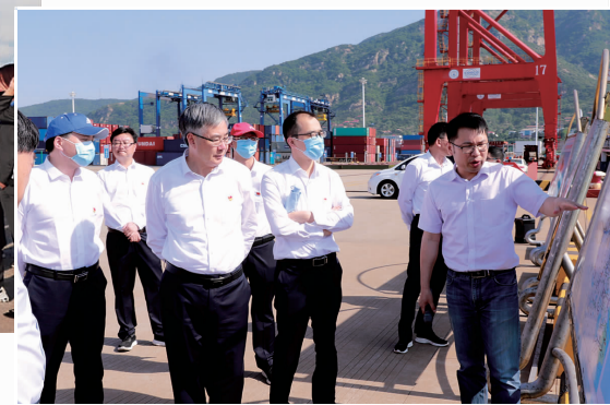
赴延安开展党性教育培训