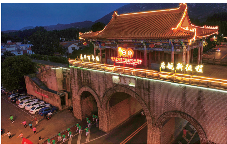
▲近日,海州胸阳门在夜色中灯光迷人,建筑上显示的庆祝中国共产党成立100周年的灯光秀格外引人注目。