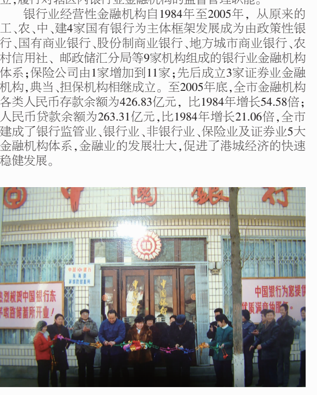
1988年9月中国银行连云港东海支行开业剪影

银行业经营性金融机构自1984年至2005年,从原来的工、农、中、建4家国有银行为主体框架发展成为由政府性银行、国有商业银行、股份制商业银行、地方城市商业银行、农村信用社、邮政储蓄汇兑局等9家机构组成的银行业金融机构体系(保险公司由1家增加到11家;先后成立3家证券业金融机构,典当、担保机构相继成立)。至2005年底,全市金融机构各类人民币存款余额为426.83亿元,比1984年增长54.56倍;人民币贷款余额为263.31亿元,比1984年增长121.08倍,全市建成了银行监管业、银行业、非银行业、保险业及证券业5大金融机构体系,金融业的发展壮大,促进了港城经济的快速稳健发展。