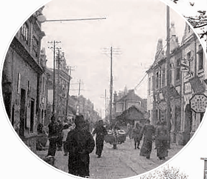
民主路老街: 中国银行新浦支行旧址

1948年12月1日,华北银行、北海银行、西北农民银行合并成立中国人民银行,发行了人民币。新海连支行自1949年2月1日起,陆续发行了12种面额的人民币。以北海币、华中币100元兑人民币(旧币)1元,收回了北海币、华中币。