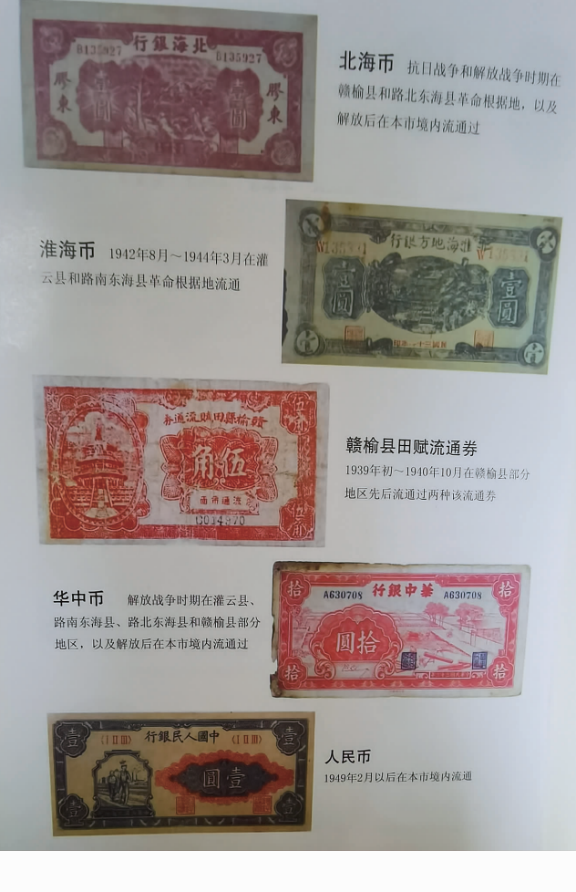
抗日战争和解放战争时期本境内流通的部分货币