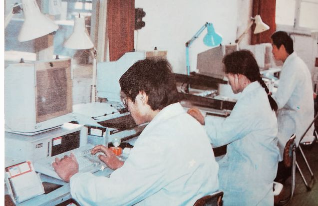
人民银行连云港市分行微机房

从“一五”时期到改革前的1978年,中国处于计划经济时期,与之相适应的是“大一统”的中国人民银行体制。人民银行既是中央银行,也是商业银行,既承担发行货币、金融管理等国家银行职责,也办理为整个经济服务的各种商业银行业务。