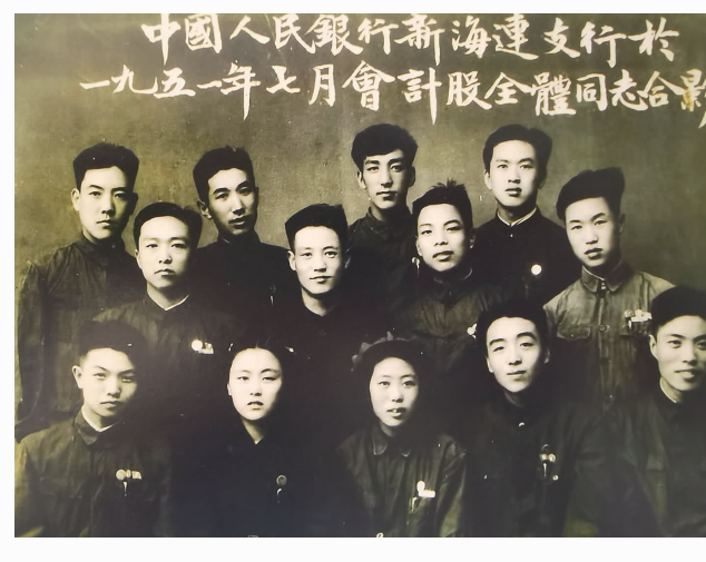
人民银行新海连支行成立时全体人员合影

至1951年底,中国人民银行新海连支行已在海州、墟沟、猴嘴、陈家港、燕尾港、连云港分别开设了办事处、营业所,办理各项业务。另有2个储蓄所,4个服务组成立,初步形成了遍布市市区城乡业务齐全的营业网点。