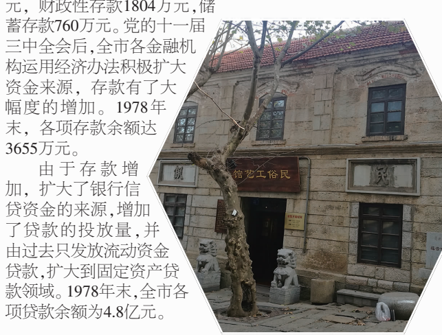
连云港市农民银行旧址

国民经济恢复和“一五”时期,连云港同全国一样,开展了大规模的经济建设和对私营企业的社会主义改造,到1957年末,存款余额为538万元,其中企业存款138万元,财政性存款160万元,储蓄存款204万元。大跃进和“文化大革命”时期,存款上升缓慢,至1976年末,各项存款余额为759万元,其中企业存款3392万元,财政性存款1804万元,储蓄存款760万元。党的十一届三中全会后,全市各金融机构运用经济办法积极扩大资金来源,存款有了大幅度的增加。1978年末,各项存款余额达3655万元。