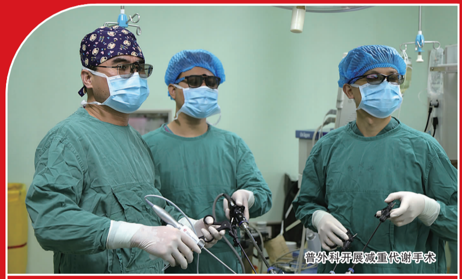
普外科开展减重代谢手术