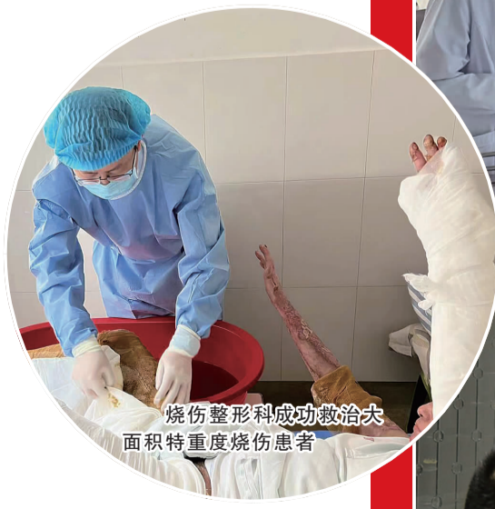
烧伤整形科成功救治大面积特重度烧伤患者

坚持和加强党对医院工作的全面领导，纵深推进全面从严治党，贯彻执行党委领导下的院长负责制，健全完善医院领导班子议事决策制度，制定实施《全面从严治党责任清单》，修订《医院党委会议事规则》《院长办公会议事规则》，建立以章程为统领的现代医院管理制度，确保医院改革发展正确方向。 坚持党建与业务工作同谋划、同部署、同推进、同考核，扎实开展“党建引领”行动，统筹推进疫情防控和业务发展，深入实施“党建+基础管理、党建+服务提升、党建+学科建设”三大工程，医院管理水平、学科内涵质量不断加强；DIP支付方式改革工作全面深入推进，公立医院绩效考核成绩稳步向前，西院区新大楼全面收尾、即将启用。 在今年我市新冠肺炎疫情防控战中，市二院党员干部职工闻令而动，日夜奋战在抗击疫情最前沿，在医院预检分诊、发热门诊、隔离病区、缓冲病房和“黄码医院”收治及援四院、援社区、援学校等疫情防控中，出色完成各项任务，用实际行动筑牢疫情防控“红色堡垒”，为我市疫情防控取得胜利贡献重要力量。援沪、援川、援疆队员逆行而上，表现出良好的职业素养和崇高的敬业精神，受到了当地政府和同行的好评，全面展现二院医风风采。 市二院党委高度重视科技创新，制定出台激励措施，积极搭建创新平台，加快提升科研创新与成果转化能力、疑难急危重症系统化救治服务能力。该院在腹腔镜、消化内镜、胸腔镜等技术以及