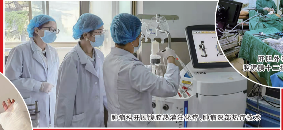
肿瘤科开展腹腔热灌注化疗、肿瘤深部热疗技术