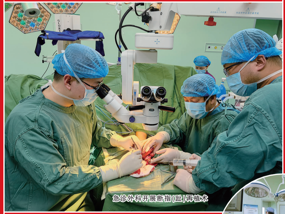
急诊外科开展断指(趾)再植术