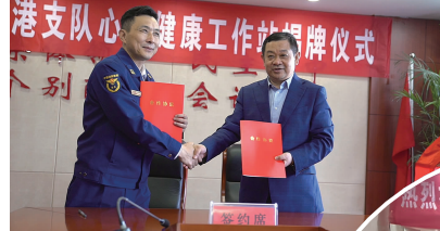
港支队心 健康工作挂牌仪式

市四院始终秉承“专科建院 质量立院 科教兴院 综合强院”的发展战略,实施“提升工程”,完善质量、服务,持续答好医院高质量发展“综合题”。