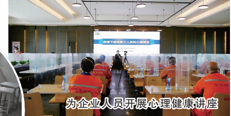
为企业人员开展心理健康讲座