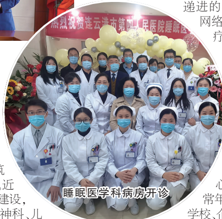
睡眠医学科病房开诊

市四院始终秉承“专科建院 质量立院 科教兴院 综合强院”的发展战略,实施“提升工程”,完善质量、服务,持续答好医院高质量发展“综合题”。