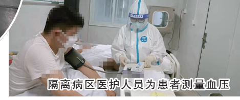
隔离病区医护人员为患者测量血压

严格落实三级预检分诊制度,全面做好工作人员健康管理,深入推进“日巡查 周督查 月研判”督查制度,进一步筑牢院感防线。二是一以贯之全力打赢突发疫情攻坚战。每次疫情发生后,该院最短时间内完成腾空工作,最快速度实现当日领导指挥、医疗救治、院感防控、技术人员调配、物资设备保障、市级医疗队伍预备等“六到位”。建立多级感控管理架构,建立联合督查机制和感控联席会议查摆制度,工作人员封闭管理,确保感控管理不留死角。加强全院全员培训考核,确保院感考核人人过关。不断完善院感制度和流程,全力保障院感安全。