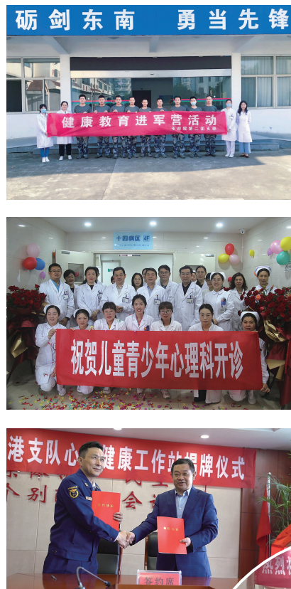
砺剑东南 勇当先锋