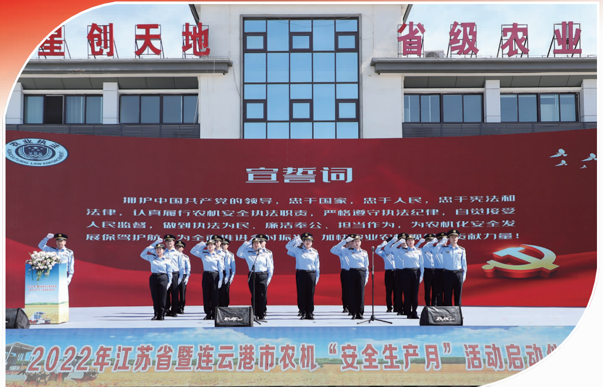
2022年江苏省暨连云港市农机“安全生产月”活动启动仪式

农为政首，谷为民命。没有农业的现代化，就没有国家的现代化。在加快建设人民期待的现代化新港城进程中，更好地实施由农业大市向农业强市的迭代升级，当是不可或缺的重要一环。 “三农”事关发展全局，上下同欲者胜。从组建的第一天起，市农业综合行政执法支队就深知肩上责任之重，围绕“抓主业、守底线、提能力、促规范、保安全”主题主线，将“红盾护农”写在砥砺前行旗帜上，用忠诚彰显初心，以执法践行使命，全力护航“三农”健康发展，笃行不怠，书写助力乡村振兴的务实奉献华丽篇章。